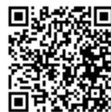
公式 LINE QR コード