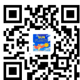
公式 Web サイト QR コード

※スクールのホームページや公式 LINE からもお問い合わせ可能です。お気軽にどうぞ♪